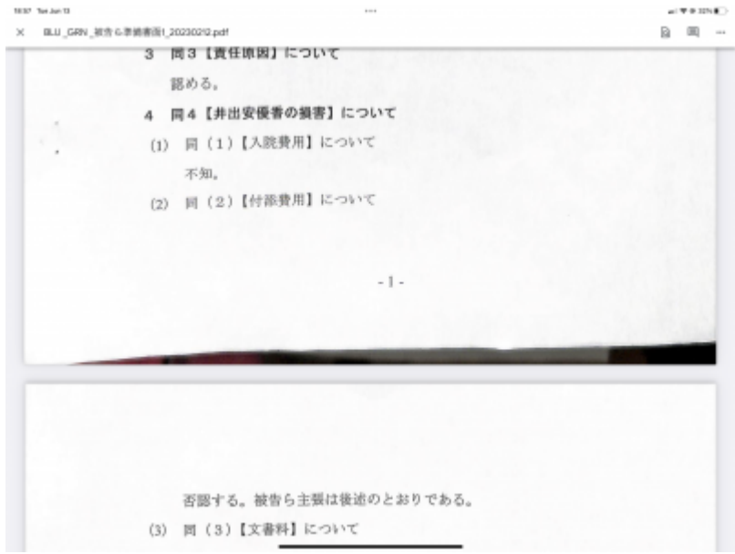
入院費は認めない